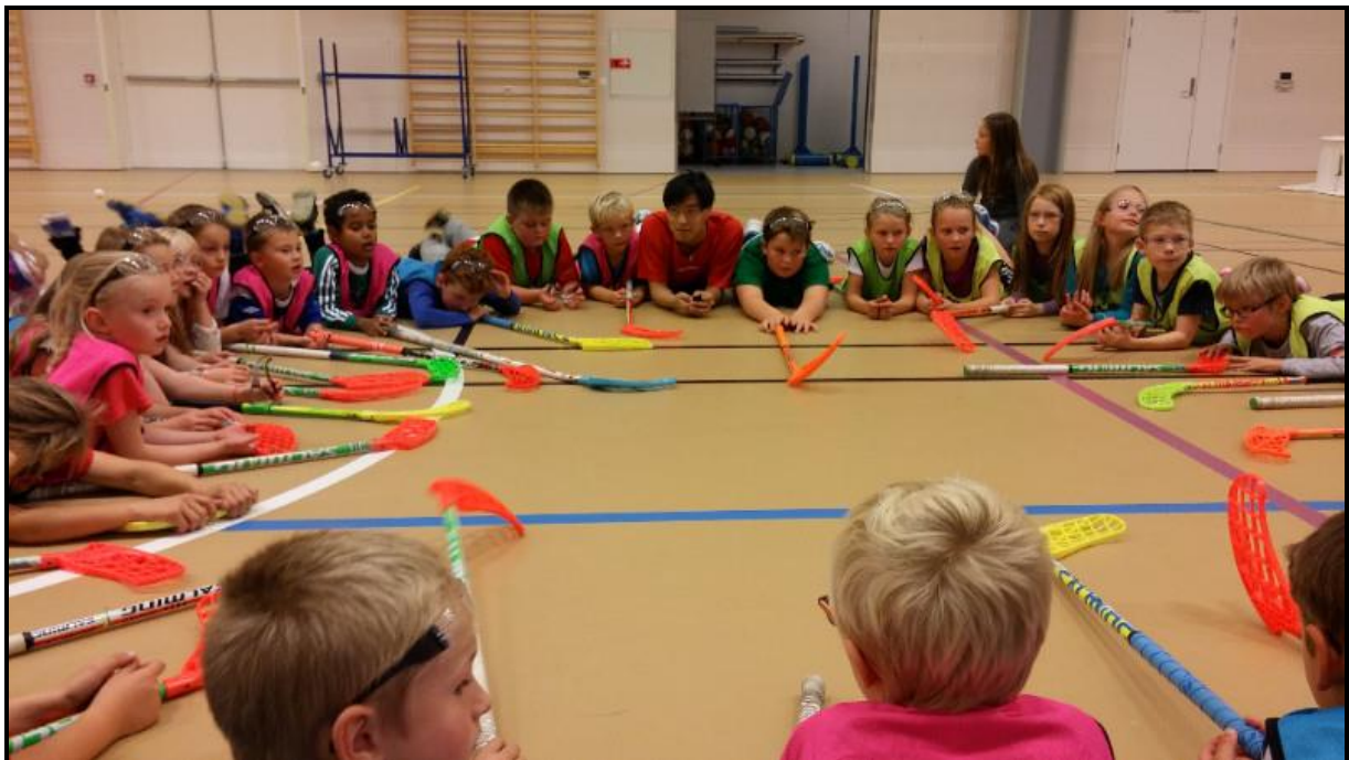
Nybegynnerkurs i Malvik, høsten 2016

Idrettens Hus, torsdag 1. juni 2017, klokka 18:00